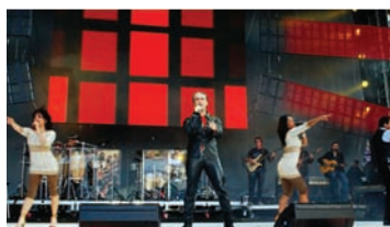
Momento de la actuación de Alejandro Fernández

"Ni el agua puede con nosotros" exclamó el público el siguiente en actuar, el español Alejandro Sanz, arropado por una banda musical de cubanos, dominicanos y estadounidenses. Alejandro Sanz ofreció a sus seguidores, en una de las actuaciones más esperadas del festival, sus grandes éxitos, sin que faltara el tema "Corazón partío" acompañado con su grupo o él solo al piano.