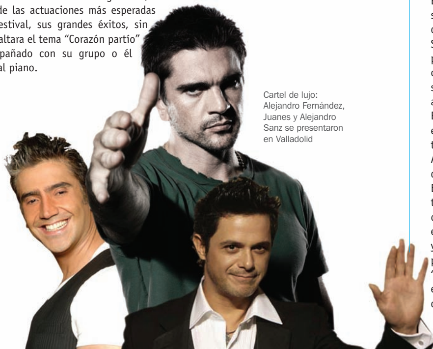
Cartel de lujo: Alejandro Fernández, Juanes y Alejandro Sanz se presentaron en Valladolid