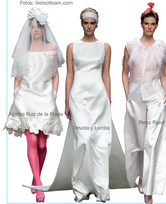
Agatha Ruiz de la Prada